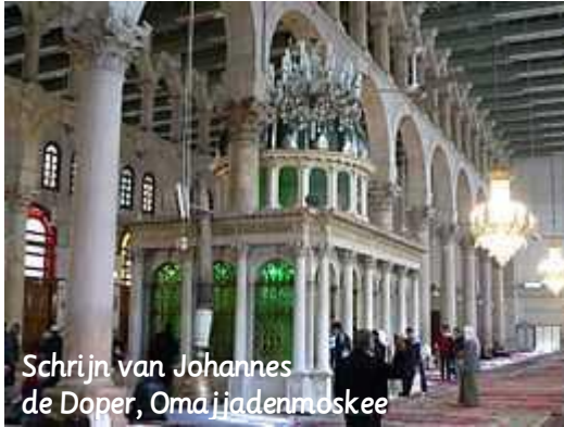
Schrijn van Johannes de Doper, Omayyadenmoskee

Eén van de torens van de moskee heet de Jezus-minaret. In de Islam wordt Jezus gezien als een profeet van God.