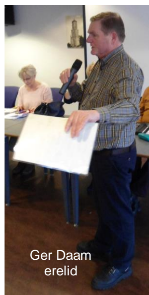
Ger Daam erelid