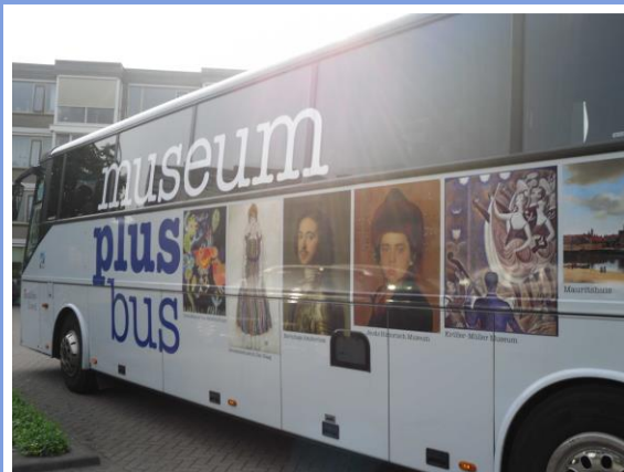
Museum Plus Bus pag. 6