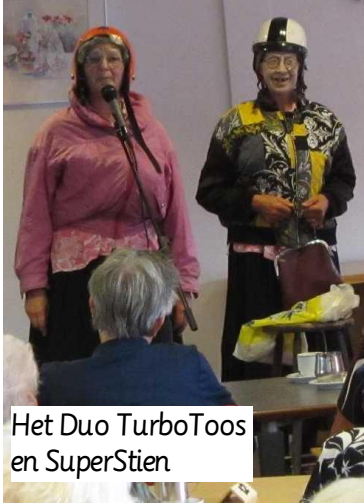
Het Duo TurboToos en SuperStien

gevierd. Officieel is 3 oktober de aangewezen dag voor de Nationale Ouderendag.