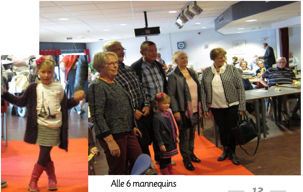
Alle 6 mannequins

De middag werd verder aangekleed met koffie,